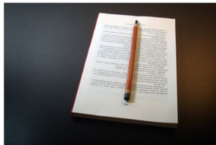
Mundo feliz al revés Impresión digital sobre papel, encuadernado a mano y lápiz tallado 2010