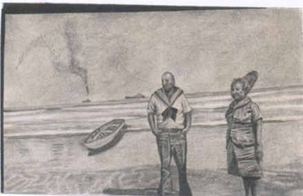
A mi cuidado estuvieron siempre mis Nanos. Aquí llegando de Hungría.