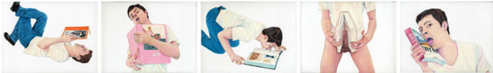
MIS AMIGOS ME AYUDAN A SER UN MEJOR ARTISTA óleo sobre tela (triptico) 2005