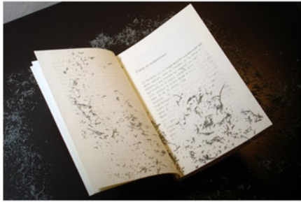
Artificios escrito y borrado a mano, gráfito sobre papel, goma, encuadernado a mano. 2010