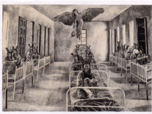
Ellos (mis Nanos) también revivieron la tradición que reunía a la familia en la hora del Angelus.