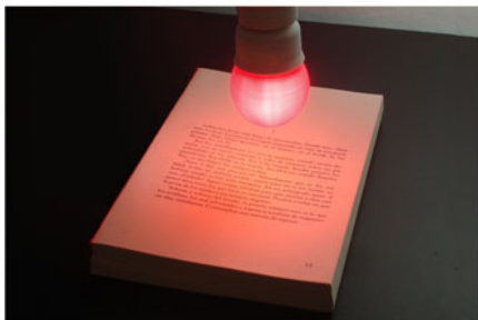
Lolita y beso Impresión digital sobre papel, encuadernado a mano y lámpara rosa 2010