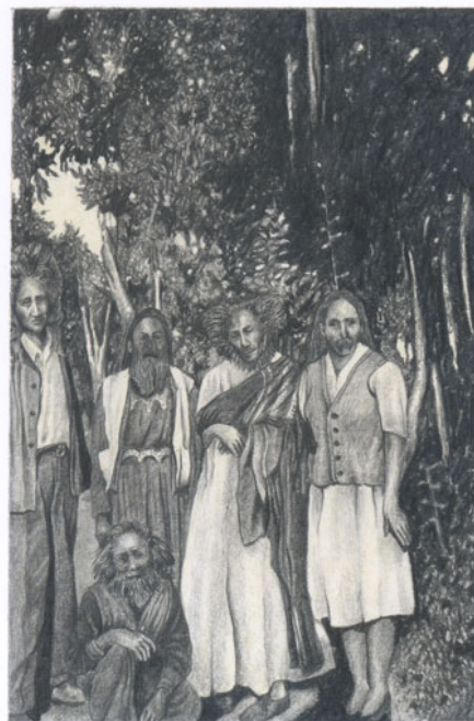
El nombre de la familia era conocido gracias a la fama de varios intelectuales que por generaciones han surgido: tíos, primos, abuelos.

Oscar Cueto, Érase una vez (serie en proceso) Grafito y pastel sobre papel, 2010