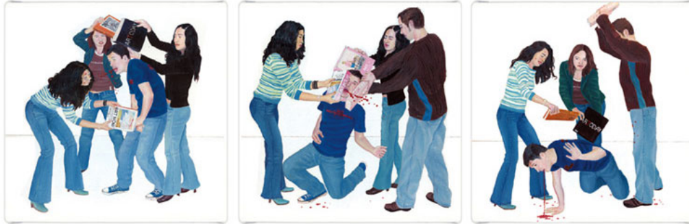
MIS AMIGOS ME AYUDAN A SER UN MEJOR ARTISTA óleo sobre tela (triptico) 2005